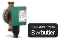
Wilo-Star-Z NOVA-SmartHome mit Kugelabsperventil, Rückschlagventil und Zwischenstecker zur Kommunikation und Fernsteuerung durch ein Smart Home Gerät Art.-Nr. 4198220